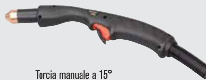
Torcia manuale a 15°