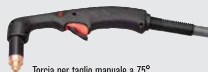
Torcia per taglio manuale a 75°

(per un numero maggiore di opzioni di torcia, consultare il sito Web www.hypertherm.com )