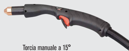
Torcia manuale a 15°