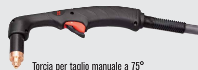
Torcia per taglio manuale a 75°

Stili di torce Duramax standard (per un numero maggiore di opzioni di torcia, consultare il sito Web www.hypertherm.com )