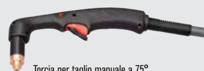
Torcia per taglio manuale a 75°

(per un numero maggiore di opzioni di torcia, consultare il sito Web www.hypertherm.com )