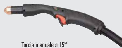
Torcia manuale a 15°